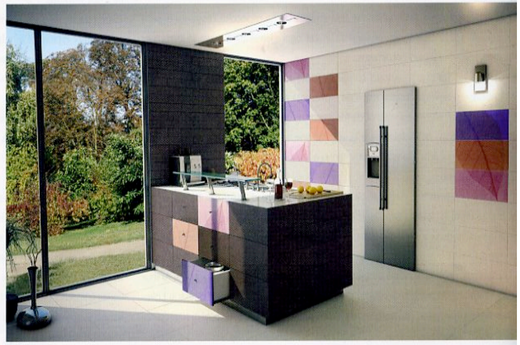
Eco-leader, Refin, 2009. Collezione di piastrelle in gres porcellanato decorato, ricavato dal riciclo di materiale pre-consumer. Eco-leader, Refin, 2009. Collection of tiles in decorated porcelain gres, obtained from the recycle of pre-consumer material.

rassegna stampa - ghenos srl 4, via Poliziano 20154 Milano